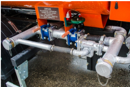
Алюминиевая сливная коммуникация