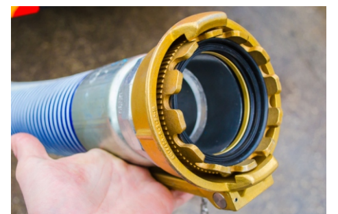
Быстроръемные соединения типа Elaflex