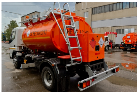
Общий вид АТЗ сзади