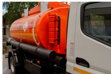
Огнетушитель в защитном корпусе