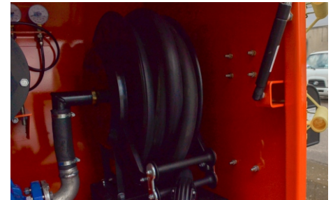
Комментарий к фотографии