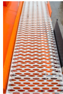
Площадка из просечного листа