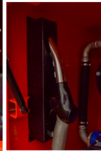
Раздаточный пистолет А-50М