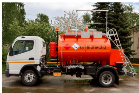
Общий вид АТЗ