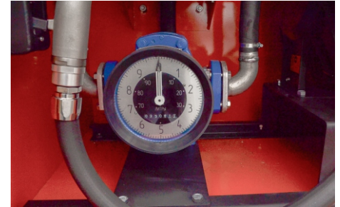
Счетчик жидкости ДД-25-1,6 СУ