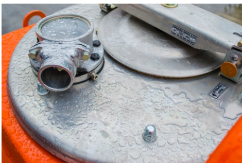
Алюминиевый заливной люк с дыхательным устройством УД-2-80