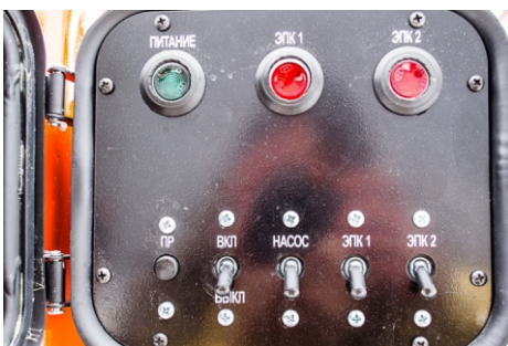
Пульт управления донными клапанами