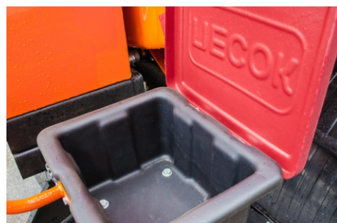
Ящик для песка