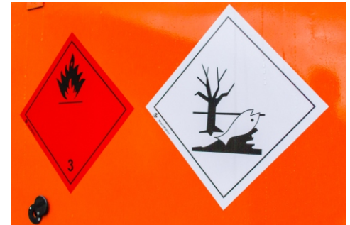
Знаки опасности 3 класс с трех сторон