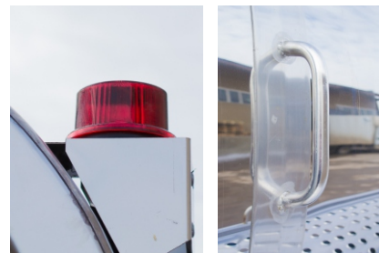
Габаритные огни Ручка для подъема на площадку