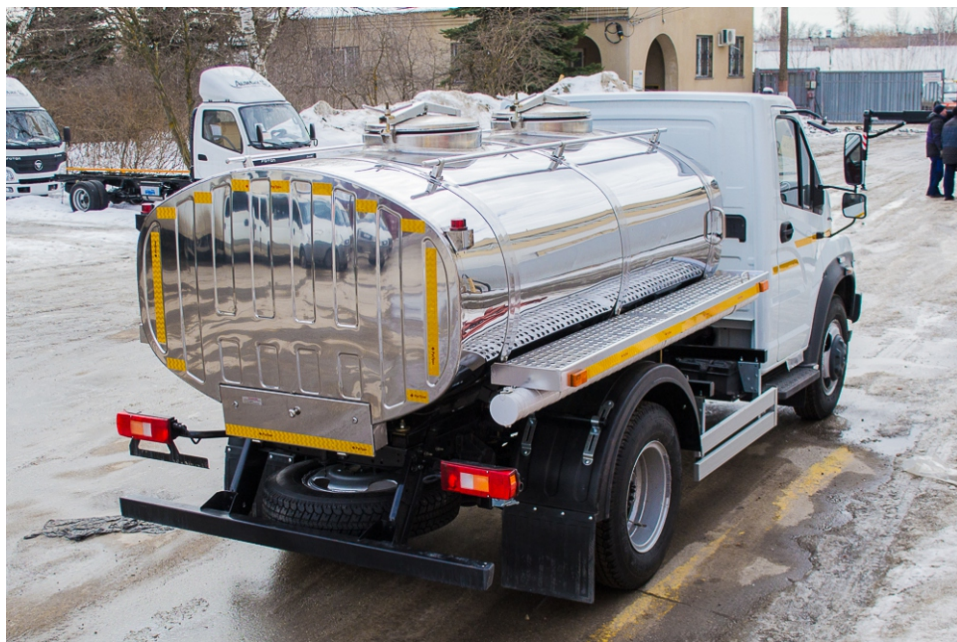
Общий вид цистерны