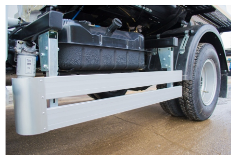
Боковое ограждение откидное алюминиевое