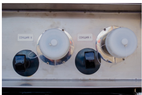
Выходы сливного трубопровода ДУ50 с молочной резьбой Rd-78, закрыты пластиковыми крышками. Рычаги управления донными клапанами