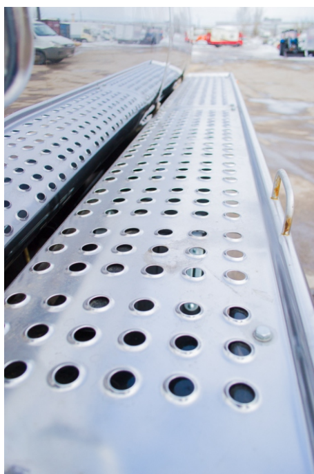
Площадка обслуживания с перфорированной противоскользящей поверхностью